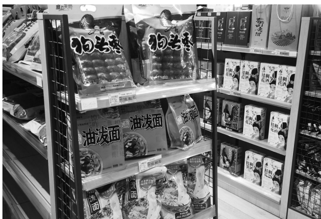
供销农场货架上摆放着各类陕西特色产品。

为了让“陕货”走得更远,陕西产销对接持续加强,陕西供销集团推动500余款陕西特色产品上架中电数科消费帮扶平台,5款大宗农产品进入中石化易捷超市,67款陕西“土特产”列入江苏省总工会APP平台产品名录。陕西供销电商“832平台”已经有3316家供应商入驻,上架商品3万多个,上半年助力陕西脱贫地区农产品销售达2.53亿元。