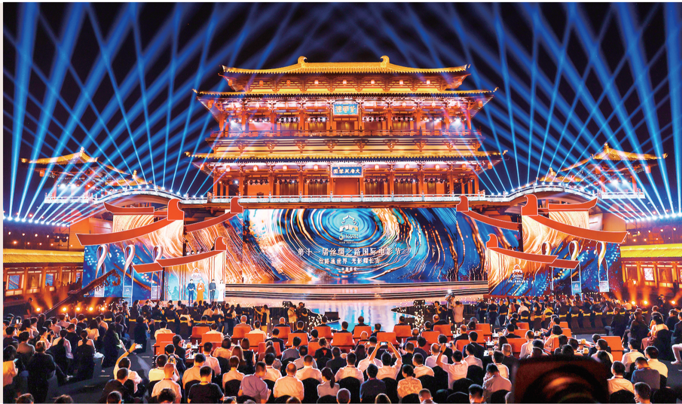
第十一届丝绸之路国际电影节颁奖典礼现场。

丝路光影，魅力陕西。9月25日晚，由中央广播电视总台、陕西省人民政府、福建省人民政府主办的第十一届丝绸之路国际电影节颁奖盛典在西安盛大举行，备受瞩目的“丝路奖”十大奖项正式揭晓。走过11年的丝路电影节，已成为民心相通、文化互鉴的平台，以海纳百川的文化魅力、沉淀千年的文明底蕴和日益深远的国际影响，在互学互鉴中展现出新时代电影浪潮之下涌动的中国电影力量。