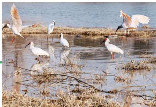
朱鹮与白鹭等水鸟共处。