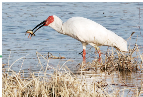
泥鳅是朱鹮的美餐。