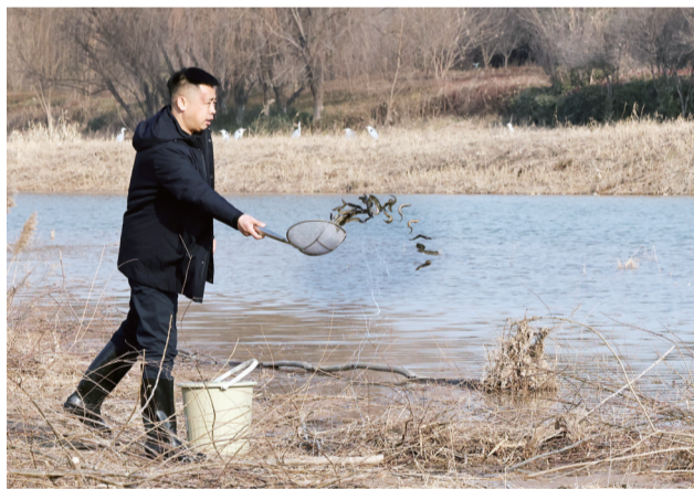
定期为朱鹮投放食物。