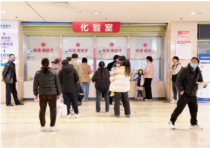
患儿家长在西安市儿童医院化验窗口排队。

近日,随着流感进入高发阶段,西安市儿童医院、长安区医院、西北妇女儿童医院曲江院区等多家医疗机构的就诊量增加。各医院迅速启动应急响应,延长门诊时间、优化就诊流程、调配停车资源等一系列便民举措密集落地,在忙碌的诊疗现场筑起一道温暖的保障墙。