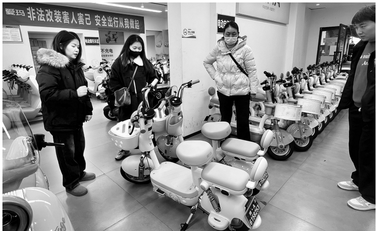
商家向消费者介绍“零公里二手车”。

记者于12月4日、10日先后两次走访西安枣园西路、伞塔路两大电动车市场发现,旧国标电动自行车并未随禁售政策退出销售环节,反而以“零公里二手车”的名义持续在市场流通,经销商通过提前上牌、签订协议、出具全套凭证等多种方式推进库存销售。